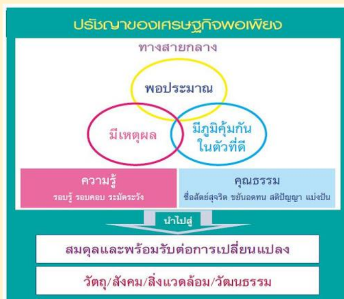
ภาพที่ ๒ แนวทางปรัชญาของเศรษฐกิจพอเพียง

เงื่อนไขที่ ๒ เงื่อนไขคุณธรรม คือ มีความตระหนักในคุณธรรม มีความซื่อสัตย์สุจริตและมีความอดทน มีความเพียร ใช้สติปัญญาในการดำเนินชีวิต